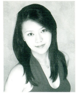
大多貴子 (ヴァイオリン)